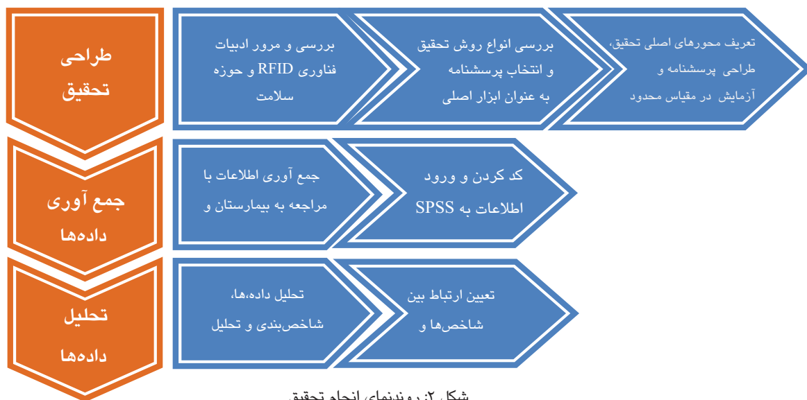
شکل ۲: روندنمای انجام تحقیق

و استفاده از فناوری‌های نوینی چون فناوری رد فاشگر می‌توان در جهت رفع نقاط ضعف گام برداشت و به بهره‌وری قابل توجهی در این بیمارستان رسید.