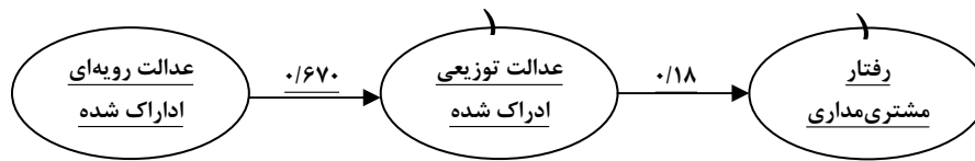
تصویر ۲: مدل مفهومی بازنگری شده و نهایی از رابطه بین ادراکات عدالت و رفتار مشتری‌مداری در پرستاران

پرستاران و جایگاه و موقعیت سازمانی آنها در بیمارستان‌های دولتی ایجاب می‌کند که توسط افراد ارشد و احیاناً سرپرست به صورت دوره‌ای تحت ارزیابی عملکرد قرار گیرند. این ارزیابی عملکرد به هر شکلی که انجام شود مبنای تصمیم‌گیری برای پاداش، ارتقاء و احیاناً اضافه حقوق و امتثال آن است. حتی از این منظر نیز عایدات پرستاران به طور جدی تحت تأثیر ادراک آنها از حضور یا عدم حضور عدل و انصاف در تمامی مراحل تصمیم‌گیری، ابلاغ و اجرای تصمیمات است. بدین ترتیب رابطه بین عدالت توزیعی و رویه‌ای و از طرف دیگر تأثیر غیرمستقیم عدالت رویه‌ای بر مشتری‌مداری از طریق عدالت توزیعی به صورت منطقی قابل تبیین است. البته کیم و همکاران [۳] که در پرستاران کره‌ای نتایجی مشابه با نتیجه پژوهش حاضر بدست آورده‌اند، معتقدند که عدم تأثیر مستقیم عدالت رویه‌ای بر مشتری‌مداری به ویژه در کره و آسیا تحت تأثیر فرهنگ جمع‌گرایی و فاصله قدرت است. ولی به نظر پژوهشگران پژوهش حاضر، برخلاف نظر کیم و همکاران [۳] تأثیر مستقیم عدالت توزیعی ادراک شده بر مشتری‌مداری خود حاکی از آن است که در رفتار مشتری‌مداری، پرستاران در قالب هویت جمعی و گروهی عمل نمی‌کنند، بلکه در درجه نخست تحت تأثیر هویت فردی است که عمل می‌نمایند. این امر از بسیاری جهات قابل تبیین است. در درجه اول هر فرد قبل از اینکه عضوی از یک گروه باشد یک شخص با مجموعه ویژگی‌های خاص و منحصر به فرد است. در کنار این امر وقتی افراد احساس نمایند که از نظر سازمان محل کار خود ارزشمند تلقی می‌شوند، چون در تخصیص پیامدهای مادی و غیرمادی برای آنها عدل و انصاف رعایت شده، هویت فردی و سپس تعلق و احترام و پیوستگی آنها بالا می‌رود. [۲] از طرف دیگر وقتی ادراک پرستاران از رویه‌های تصمیم‌گیری منصفانه