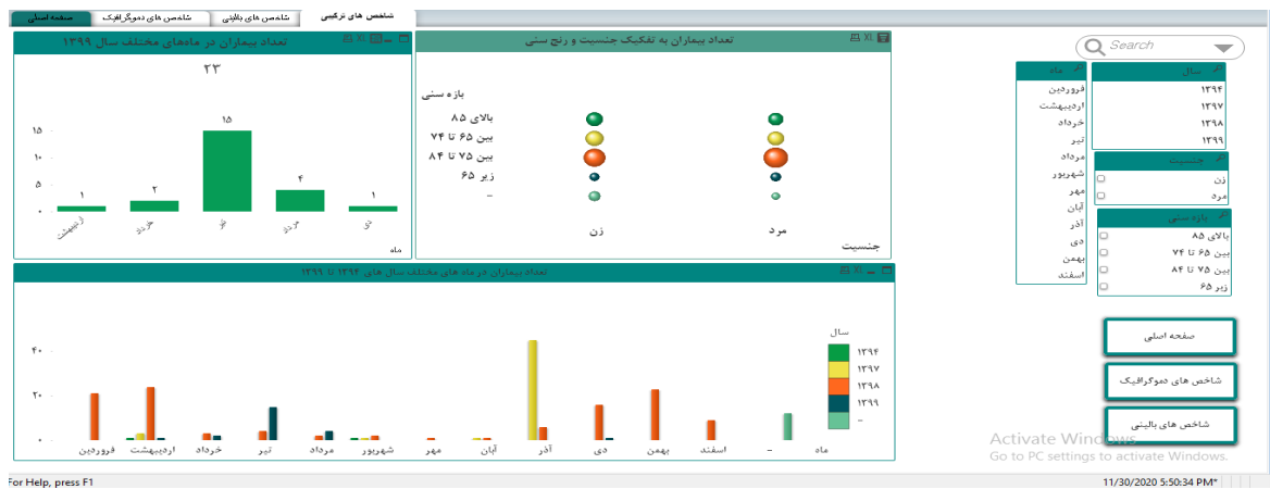
شکل ۴: صفحه مربوط به شاخص‌های ترکیبی داشبورد برای نظام ثبت بیماری آلزایمر