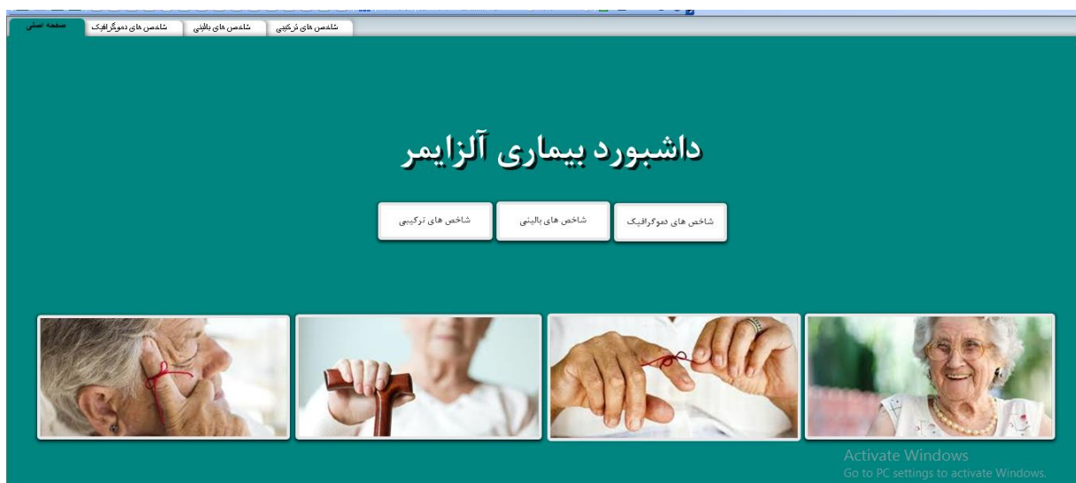
شکل ۱: صفحه اصلی داشبورد برای نظام ثبت بیماری آلزایمر

در قسمت یافته‌های مربوط به طراحی داشبورد برای نظام ثبت بیماری آلزایمر، ویژگی‌های اصلی داشبورد نظیر معیارهای مخاطب هدف، مرزهای صفحه، نمایش داده ضروری، نیاز داده به متن، چیدمان داده، انتخاب رسانه نمایش، طراحی رسانه نمایش، برجسته کردن اطلاعات مهم، پالت رنگ، جذاب کردن داشبورد در نظر گرفته شد. بر این اساس،