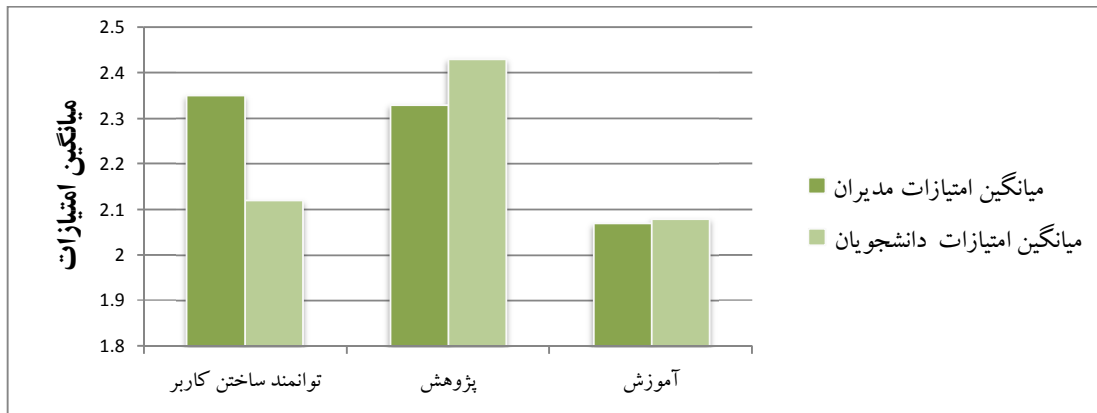
نمودار ۱: اولویت بندی نقش کتابخانه مجازی در آموزش مجازی

مطالعه (۶/۷) سال با انحراف معیار (۲/۲۲) بوده است. از ۲۰۸ دانشجویی که پرسشنامه‌ها را تکمیل نمودند، ۱۰۶ نفر مرد و ۱۰۲ نفر زن بوده‌اند. که از میان آن‌ها ۱۲۸ نفر ساکن شهر تهران و ۸۰ نفر ساکن سایر شهرها بوده‌اند. نقش کتابخانه مجازی در آموزش مجازی در سه بخش: آموزش، پژوهش و توانمند ساختن کاربر بررسی شد. بر اساس