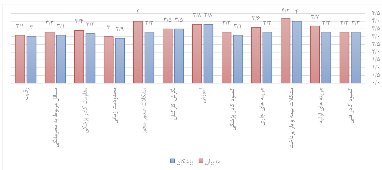
شکل ۲. مقایسه میانگین نمرات مربوط به موانع استفاده از پزشکی از راه دور از دیدگاه مدیران و پزشکان

کشورهای در حال توسعه در اجرای پزشکی از راه دور است. در مطالعه عباسی و همکاران [۱۷] در داخل کشور نتایج مربوط به پاسخ‌های شرکت‌کنندگان در خصوص شرایط فعلی محیط کاری سامانه پرونده الکترونیک سلامت ایران (سپاس) از جنبه‌های مختلف اقتصادی، فنی، انسانی و مدیریتی ارزیابی شد و نتایج حاکی از آن بود که حیطة تجهیزات فنی امتیاز متوسطی را از کاربران دریافت کرد. می‌توان نتیجه گرفت که زیرساخت‌های فنی و ارتباطی موجود در مراکز مورد مطالعه اگرچه پایه‌ای و قابل‌انکاس است ولی فاقد اجزای پیشرفته و پشتیبانی مالی مستمر است و در حد متوسط قرار دارد. ضعف موجود در پوشش اینترنت و ذخیره‌سازی داده موجب محدودیت اجرا در خدمات پزشکی از راه دور بلادرنگمی‌شود. ارتقای زیرساخت باید با آموزش مداوم نیروی انسانی، استانداردسازی تجهیزات و سرمایه‌گذاری هدفمند همراه شود تا به‌جای پیاده‌سازی آزمایشی، به سطح عملیاتی پایدار برسد.