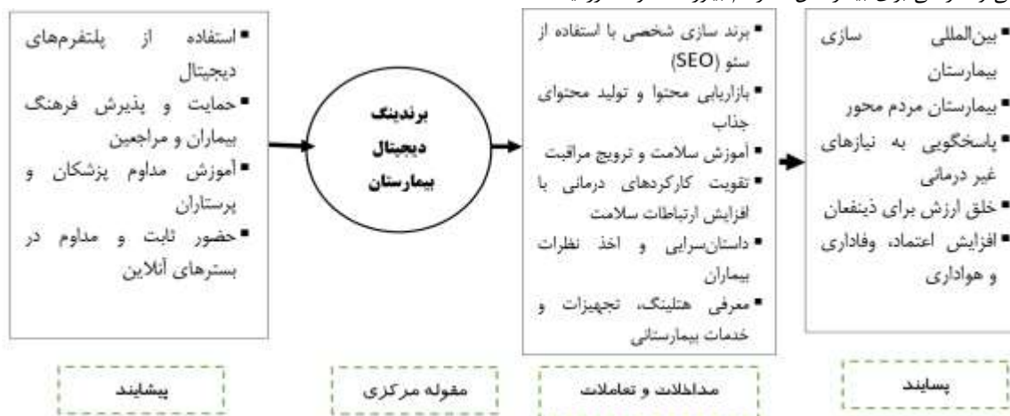
شکل ۱. الگوی برندینگ بیمارستان‌ها در عصر دیجیتال در ایران بر اساس نظریه مبنایی ( اشتراووس و کوربین، ۲۰۱۴)

"محتوای آنلاین برای بیماران و خصوصاً بیماران مزمن که نیاز به پیگیری و مراجعات مجدد به بیمارستان برای ادامه درمان دارند خیلی در کیفیت درمان و شهرت بیمارستان اهمیت دارد باید بیمارستان‌ها برای اعتبار خودشان هم شده این کار رو انجام دهند" (م. ۴) "امروزه بیمارستان‌ها باید جامعه نگر و بیمار محور باشند و این کار صرفاً با تکیه بر فضای مجازی و دیجیتال امکان‌پذیر هست که شما می‌توانید نظرات و صدای بیماران را بشنوید و به راحتی به تقاضای آن‌ها و نیازهای جدید درمانی که وجود دارد آگاه شوید" (م. ۶) "برندسازی شخصی برای پزشکان و کادر درمان امروزه مهم‌ترین استراتژی بازاریابی است که فضای مجازی می‌تواند این فرصت را برای برندسازی شخصی و سازمانی برای بیمارستان‌ها فراهم بیاورد. خصوصاً در زمینه