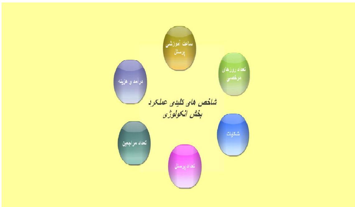
شکل ۲: صفحه شاخص های انتخابی بخش مربوط به ویژگی تعیین شاخص های کلیدی عملکرد