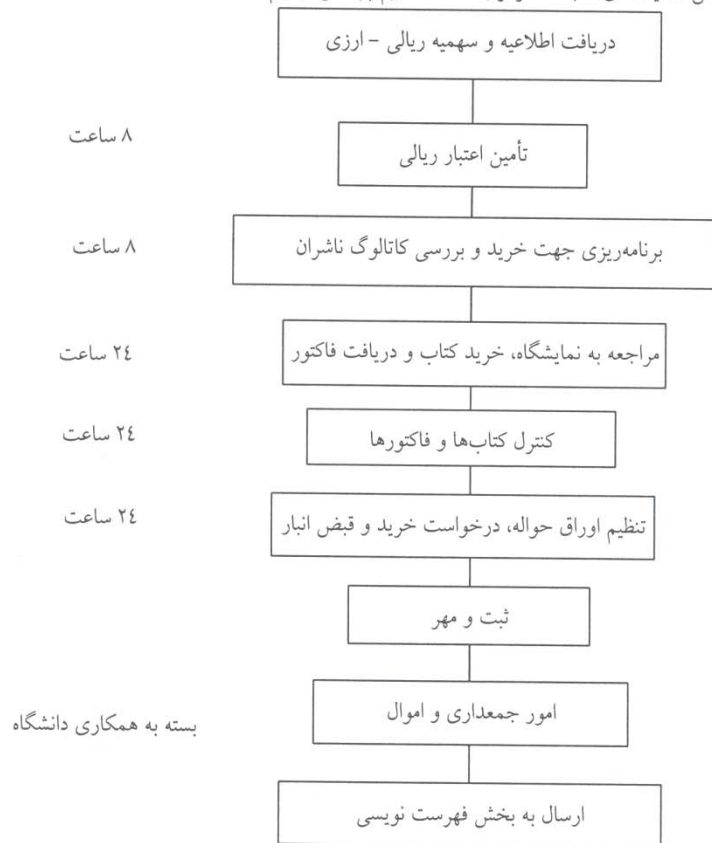
نمودار شماره ۱ - جریان کار بخش مجموعه‌سازی

در مورد بررسی بهره‌وری کتاب‌های خریداری شده از نمایشگاه بین‌المللی کتاب، رسم نمودار، جریان کار ۱ ضروریست. نمودار مذکور براساس فعالیت‌های کتابخانه مرکزی دانشگاه علوم پزشکی ترسیم شده است.