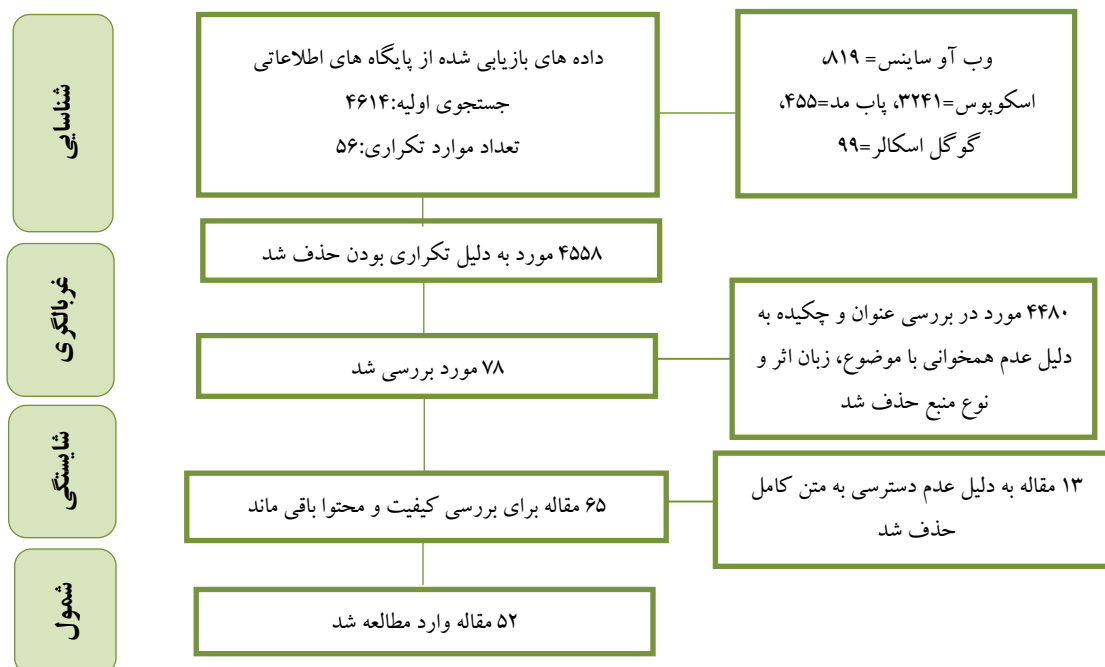
شکل ۱: فرایند بررسی و انتخاب مطالعات

در حوزه واقعیت‌های دیجیتال در کتابخانه‌ها را نشان می‌دهد. براساس شکل دو، مقالات مروری و مطالعات موردی به ترتیب با ۱۹ و ۱۲ مورد بیشترین و مطالعات نیمه تجربی و