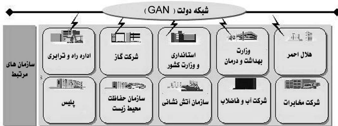
شکل ۴: بخش های مختلف سیستم NDIMS