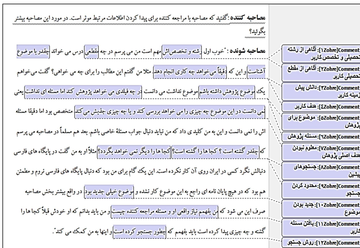
شکل ۱: نمونه ای از کد گذاری

باز، کد گذاری محوری و کد گذاری انتخابی انجام شد. به دلیل زیاد بودن حجم داده ها، کد گذاری انتخابی و محوری داده ها به طور جداگانه از کد گذاری باز انجام شد. در مرحله اول، کد گذاری باز بر ۱۰ مصاحبه انجام گرفت و تمرکز تحلیل بیشتر بر متن هر مصاحبه و به صورت جداگانه بود، بی آنکه ارتباط بین طبقات به دست آمده با یکدیگر مقایسه شوند (شکل شماره یک). سپس در صورت نیاز، مصاحبه