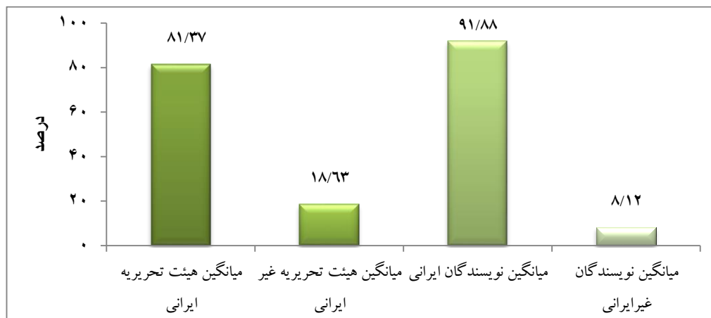
نمودار ۲: میانگین مشارکت در هیئت تحریریه و نگارش مقالات مجلات نمایه نشده در وب‌آوساینس به تفکیک ایرانی و غیر ایرانی

هیچ یک از مجلات دارای شناساگر اقلام ناشر (Publisher Identifier (PII)) نیستند و تنها ۱۵/۷ درصد از مجلات دارای شناساگر اشیاء دیجیتال (Digital Object Identifier (DOI)) هستند.